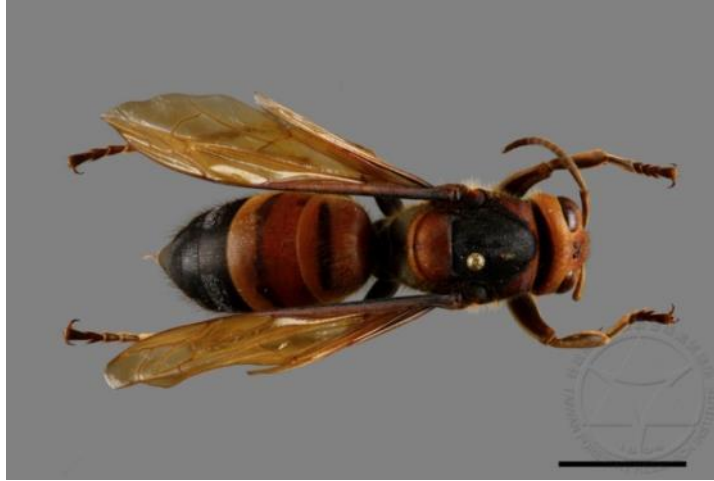
圖 5 姬虎頭蜂成蜂個體

洞中，蜂巢有外殼呈淺灰色，較難尋獲。巢脾數目 2~3 個，巢房數目 300~600 個，蜂之數量約在 100~200 隻間，蜂群在 11 -12 月間解體多[2],[3],[6],[8],[9]。