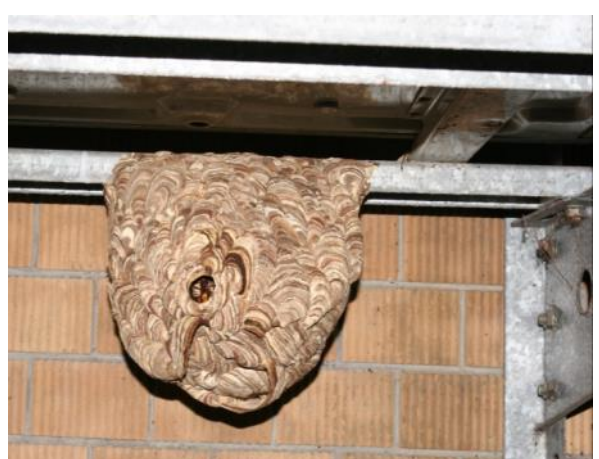
圖 15 虎頭蜂容易築巢之地點，左上：新店森林步道山壁上，左中：北市大安區公寓頂樓屋簷下，左下：北市中山區公寓四樓窗外，右上：台大校園儲水塔鋼架，右中：台大校園建築物窗型冷氣機旁，右下：台北市羅斯福路政府單位分離式冷氣室外機下。