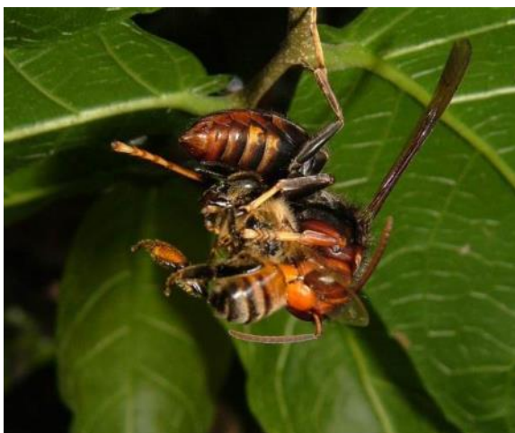
圖 4 黃腳虎頭蜂捕捉西洋蜜蜂

虎頭蜂在森林中究竟能夠捕食多少有害昆蟲？對於維持森林生態的平衡有多少實質貢獻，實難以正確估算。虎頭蜂每年捕食大量的蜜蜂，以捕捉的蜜蜂佔捕捉農林害蟲的總數 6% 來估算，各種虎頭蜂一年捕捉蜜蜂的總數 937,919 隻，以每群蜜蜂的外勤蜂 10,000 隻計算，約 94 箱蜜，對養蜂工作者來說是不小的損失(圖 4)。