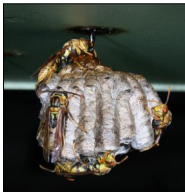
圖 2 位於屋簷下的長腳蜂

長腳蜂之成蜂飛行時，後腳垂下，黑黃相間且修長的雙腳十分明顯。屬原始社會性的胡蜂，蜂巢通常只有單個，形狀近似蓮蓬頭，外表無巢殼保護，蜂群個體通常少於 50 隻，築巢地點大多在建築物上或矮灌木叢中，具攻擊性且與人類活動範圍幾乎重疊，不過，其傷害程度不若虎頭蜂猛烈。