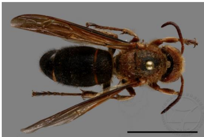
圖 13 黑腹虎頭蜂成蜂個體