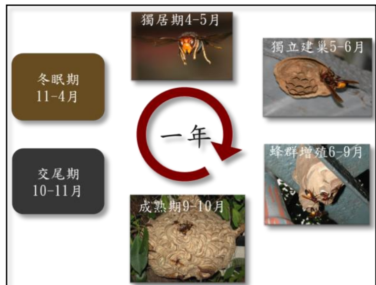
圖 16 虎頭蜂生命週期示意圖

俟近 11 月下旬，天氣逐漸轉冷，幼蟲減少，巢內的老工蜂壽命燃盡，此時如採摘到蜂巢，巢中可能只有少數成蜂