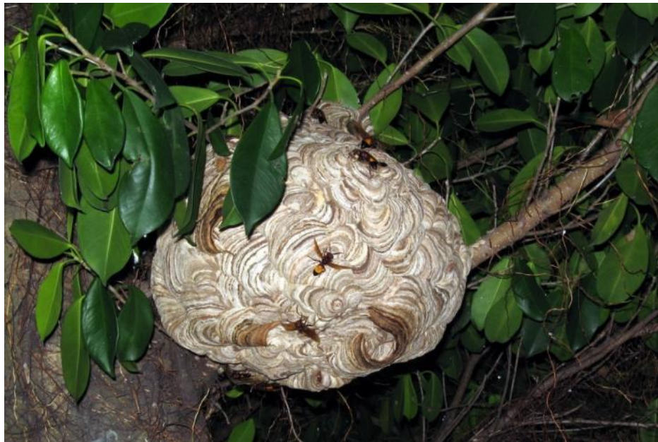
圖 8 黃腰虎頭蜂的蜂巢