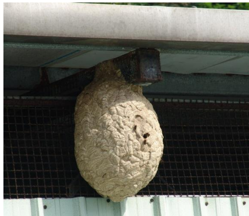
圖 11 冬季 1 月黃腳虎頭蜂群仍未崩解