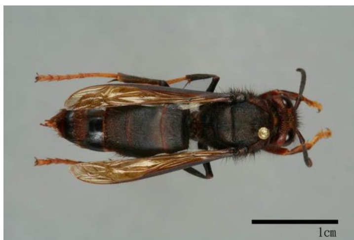
圖 9 黃腳虎頭蜂成蜂個體

2. 分布：巴基斯坦東北部到中國的中部及南部，南抵大、小蘇丹島、印尼的西里伯島。臺灣山區的優勢種，多分布於中海拔 1,000~2,000 公尺的山區，高低海拔均普遍分布，最高可達 2,500 公尺[2]-[5]。