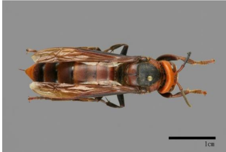
圖 6 擬大虎頭蜂成蜂個體