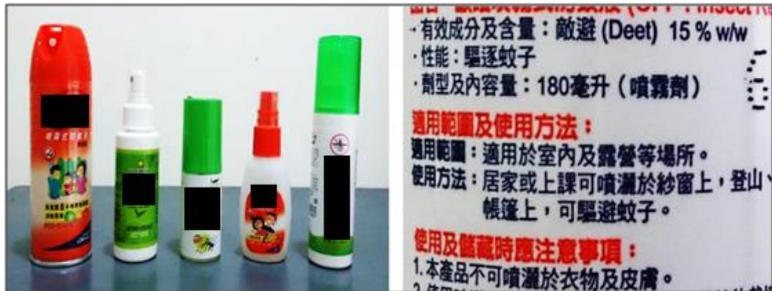
圖 17 左圖：市售防蚊液，成分為含有敵避 (DEET) 及不含兩類；