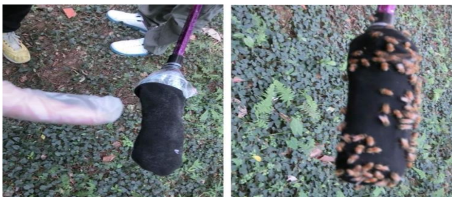
圖 18 左圖：噴灑含 DEET 成分的防蚊液的黑布，可防止蜜蜂靠近螫叮，