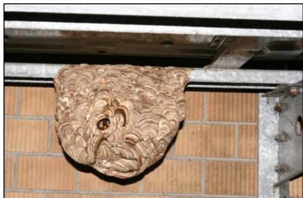
圖 3 分離式冷氣之室外機下的黃腰 虎頭蜂蜂巢