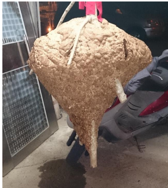
圖 14 黑腹虎頭蜂巨大的蜂巢。請注意其出入口為長條溝狀，通常會有 3~4 處溝狀出入口，俾使其可瞬間發動大量攻擊蜂。

1973 年 10 月曾在南投縣埔里發現一個可能是世界紀錄史上最大的蜂巢，直徑 65 公分，高 95 公分，有 3 個出入口，有蜂巢結構的詳細描述[12]。12 月份(1984 年 12 月採集)蜂的數目 17,764 隻，會在次年 1~2 月間蜂群解體。巢脾數目 10~30 個，巢房數目 40,000 個或更多 [2],[3],[6],[8],[9]。