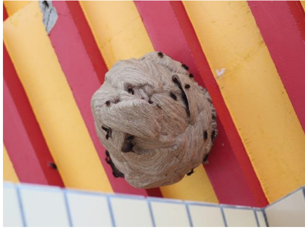
圖 10 發展中的黃腳虎頭蜂巢