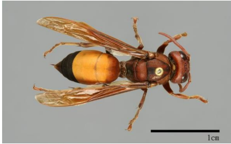
圖 7 黃腰虎頭蜂成蜂個體