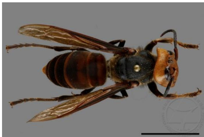
圖 12 中華大虎頭蜂成蜂個體