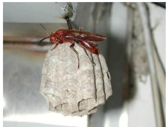
圖 1 左圖：黑腹虎頭蜂，右圖：棕長腳蜂